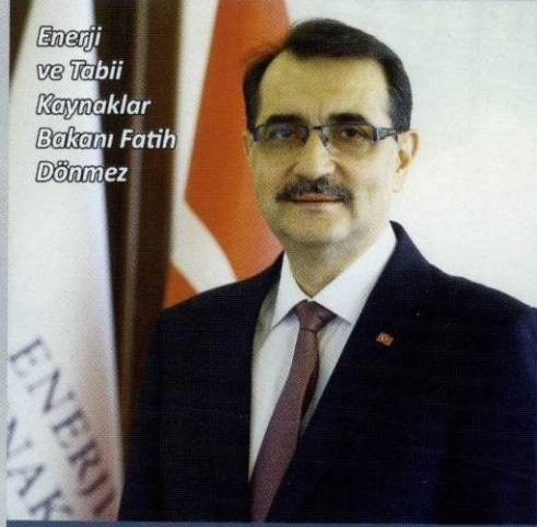
Enerji ve Tabii Kaynaklar Bakanı Fatih Dönmez

Enerji ve Tabii Kaynaklar Bakanı Fatih Dönmez, "Türkiye'nin rüzgar potansiyelinin en önemli göstergelerini dört önemli rekorla gördük. 2020, adeta rüzgar enerjisinin yılı oldu. Rüzgar kurulu gücümüzü son 18 yılda 400 kat artırdık" dedi.